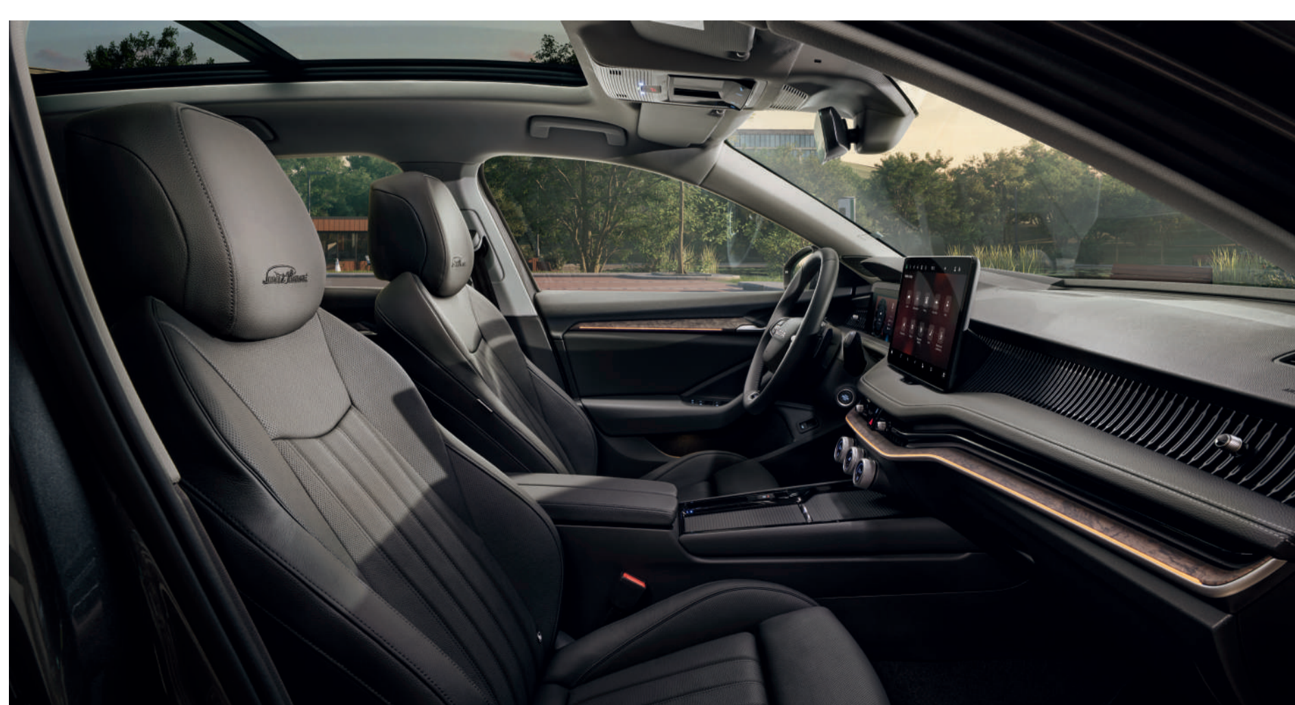
Interjeras „Suite Black L&K“