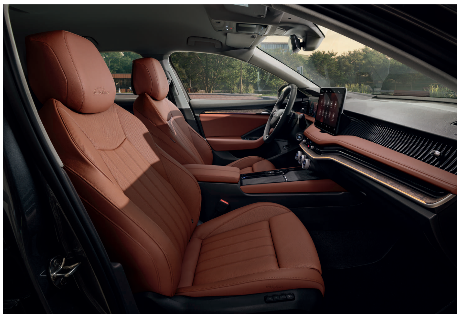
Interjeras „Studio Cognac L&K“