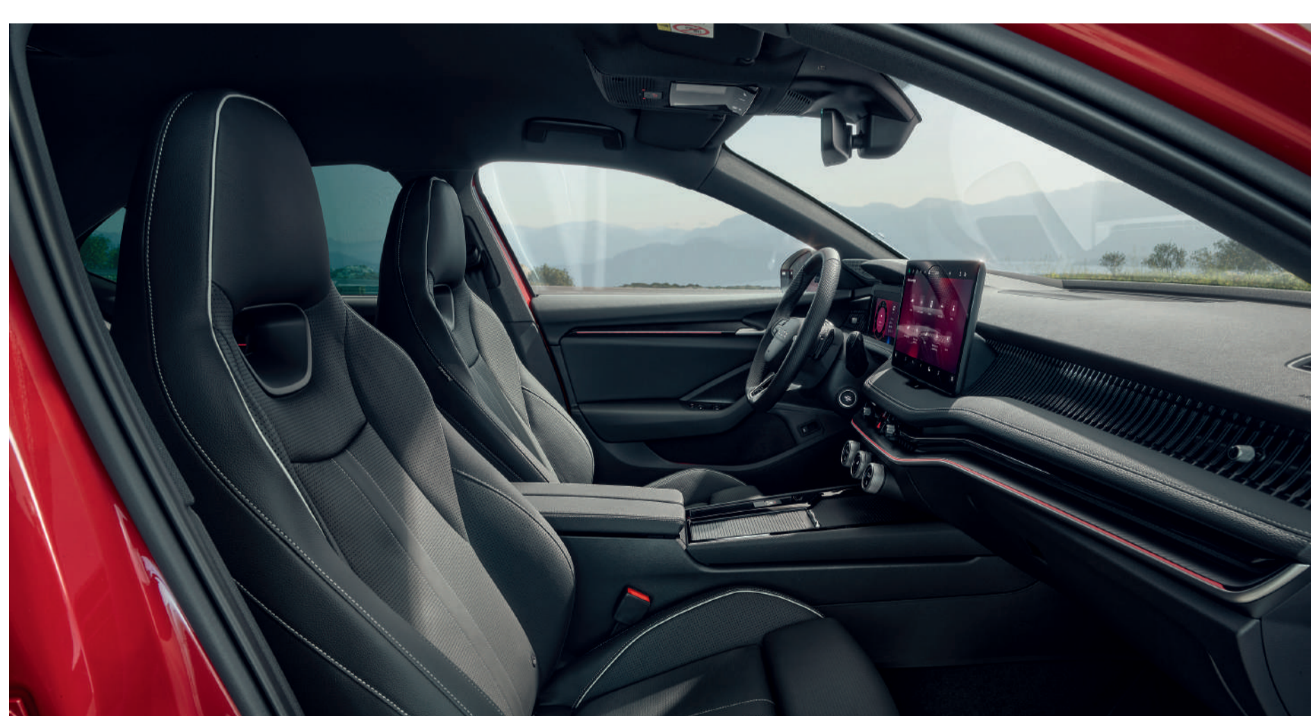
Interjeras „SportLine Suite“