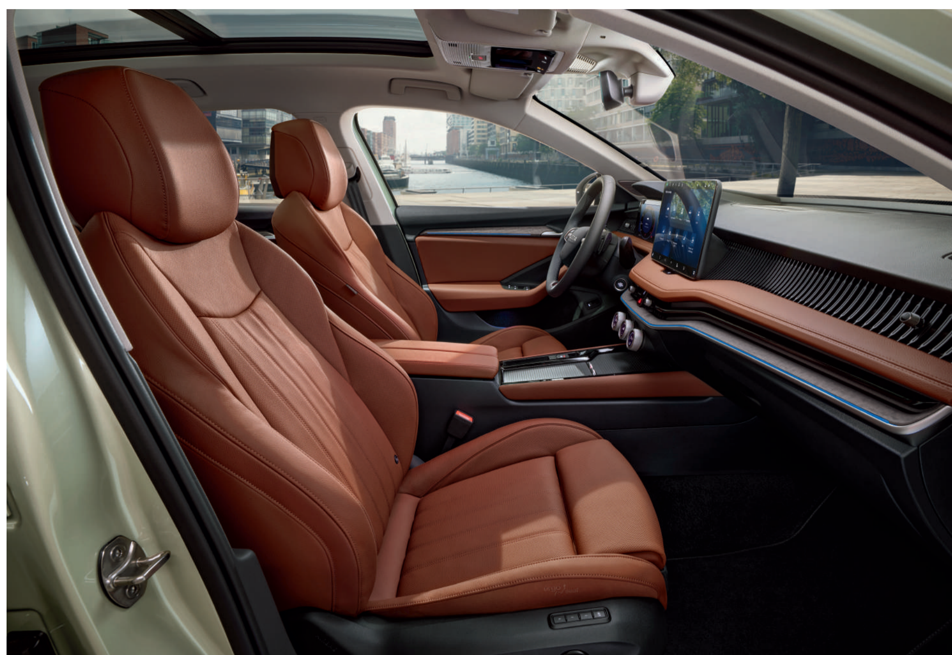
Interjeras „Suite Cognac“