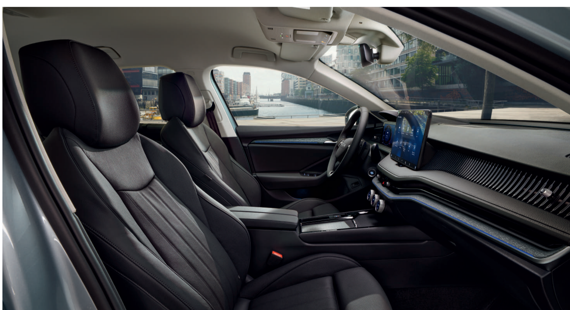
Interjeras „Suite Black“